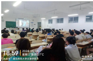
▲同学们正在观看电影

电影《婚纱》中有一句台词“为什么你要一直说再见”，很多同学看到这里时，都忍不住流下了眼泪，有的更是哭到喉咙哽咽，眼睛红肿。电影中的母亲是一名婚纱设计师，由于那时忙于事业，疏于对女儿的关心，女儿在成长中性格也变得乖戾，不合群，到后来母亲身患癌症才幡然醒悟，开始满足女儿的各种愿望，甚至是为年纪尚小的女儿做一件独一无二的婚纱。观看完毕整部电影后，很多同学久久难以从电影情节中走出来，也不禁开始想念起自己的母亲。各班心理委员组织同学们写下一段简短的观影感悟及未来期许，并召开心理委员会，与各个班心理委员分享本活动的成果，然后进行活动总结。